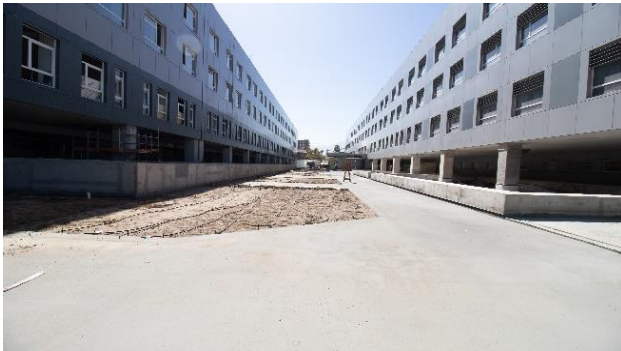
Primer Piso, Vista entre ING y HDS