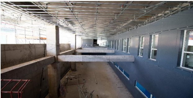
Vista interior desde primer piso a S01 sector norte HDS - UEH