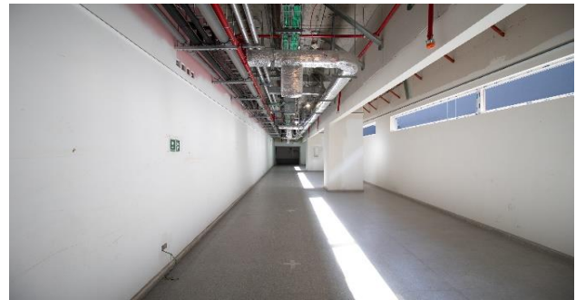
Vista interior pasillo S01 - Sector Vestidores ING