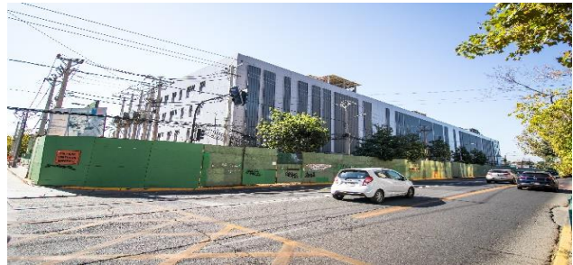
Edificio AA esquina Salvador con Alessandri