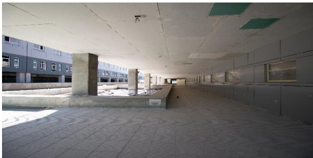
Vista pasillo primer piso ING de poniente a oriente, a la izquierda edificio HDS