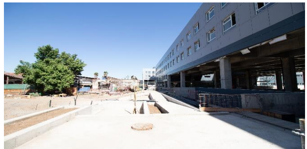
Edificio HDS a la derecha, vista de Oriente a poniente primer piso