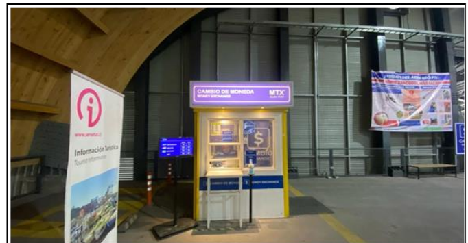
4. Zona de Servicios