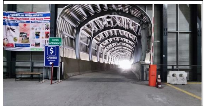
2. Zona de Andenes