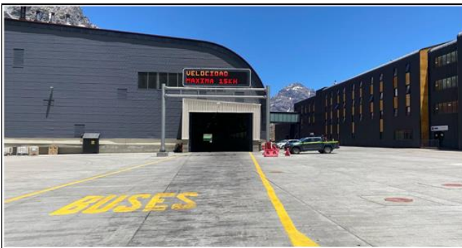
3. Zona de Buses del Complejo