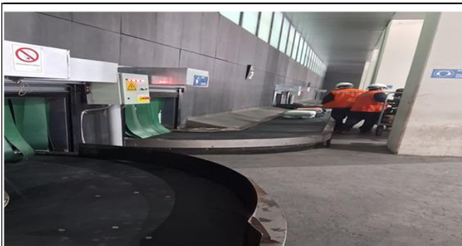
5. Zona Aduanas