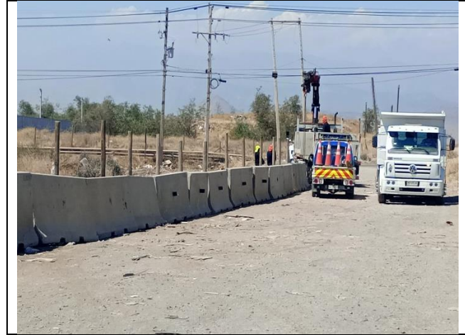
Condición Preexistente Subsector B3 – Sin Obras