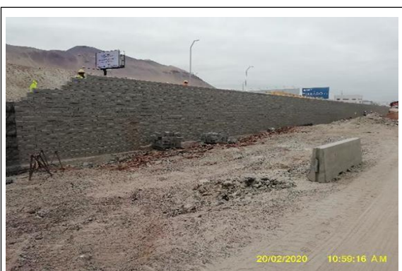
Obras Exteriores, Construcción Muro TEM Mesa 3