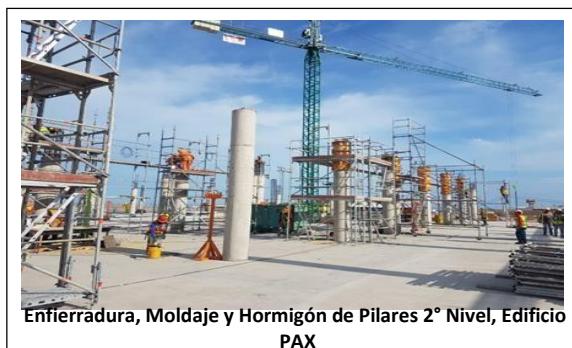
Enfierradura, Moldaje y Hormigón de Pilares 2º Nivel, Edificio PAX

A la fecha, y en base a lo indicado en el punto anterior, la SC durante este periodo ha procedido con el avance de obras, las cuales se presentan en el siguiente registro fotográfico: