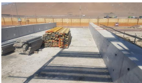
Enfierradura, Moldaje y Hormigón Puente de Acceso N°2, Edificio PAX