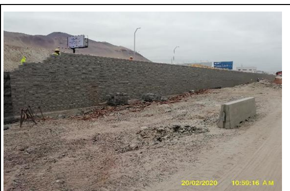
Obras Exteriores, Construcción Muro TEM Mesa 3