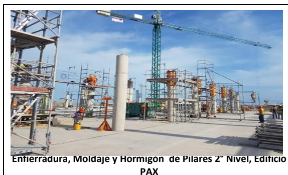
Enterradura, Moldaje y Hormigon de Pilares 2º Nivel, Edificio PAX

A la fecha, y en base a lo indicado en el punto anterior, la SC durante este periodo ha procedido con el avance de obras, las cuales se presentan en el siguiente registro fotográfico: