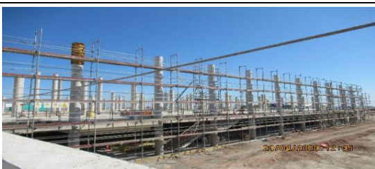
Ampliación Terminal de Pasajeros, Sector 1.1