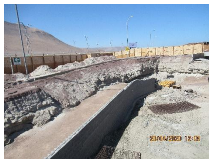
Construcción Obras Exteriores, Muro TEM