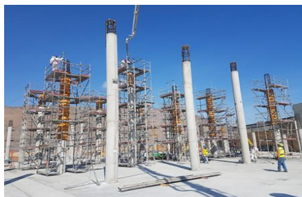
Enfierradura, Moldaje y Hormigón de Pilares 2º Nivel, Edificio PAX

A la fecha, y en base a lo indicado en el punto anterior, la SC durante este periodo ha procedido con el avance de obras, las cuales se presentan en el siguiente registro fotográfico: