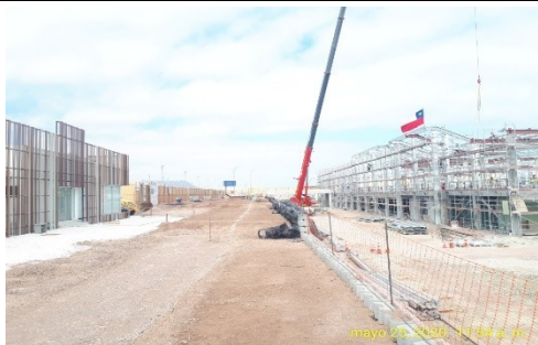
Vista Edificio Terminal de Pasajeros, Zona 1.1 y 1.2 (Ampliación)