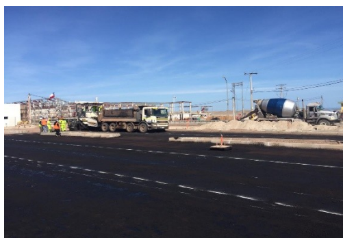
Trabajos de colocación de asfalto, estacionamiento concesionado (6.500 m 2 )

Durante el mes de mayo, no se presentaron reclamos