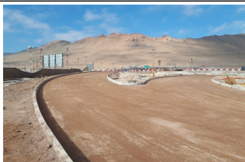
Base Estabilizada sector PAX, Calle Piso 1