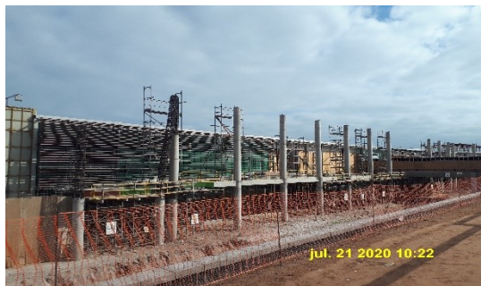
Ampliación zona 1.2 , facha Terminal de Pasajeros