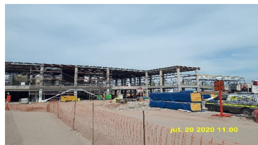
Trabajos de Montaje de Cubierta Zona 1.1 (Ampliación), Terminal de Pasajeros

A la fecha, y en base a lo indicado en el punto anterior, la SC durante este periodo ha procedido con el avance de obras, las cuales se presentan en el siguiente registro fotográfico: