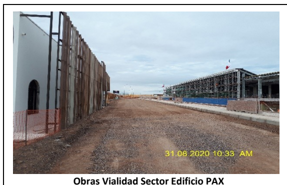
Obras Vialidad Sector Edificio PAX