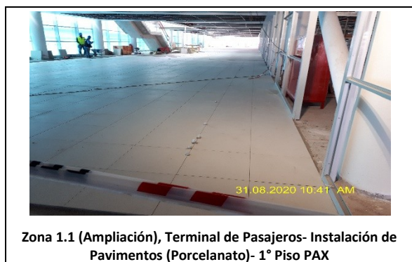
Zona 1.1 (Ampliación), Terminal de Pasajeros- Instalación de Pavimentos (Porcelanato)- 1° Piso PAX

A la fecha, y en base a lo indicado en el punto anterior, la SC durante este periodo ha procedido con el avance de obras, las cuales se presentan en el siguiente registro fotográfico: