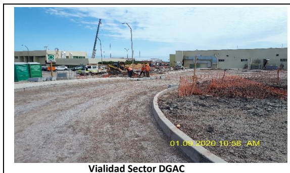
Vialidad Sector DGAC