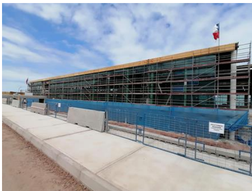
Estructuración Muro Cortina, Ampliación Sector 1.1 Terminal de Pasajeros

A la fecha, y en base a lo indicado en el punto anterior, la SC durante este periodo ha procedido con el avance de obras, las cuales se presentan en el siguiente registro fotográfico: