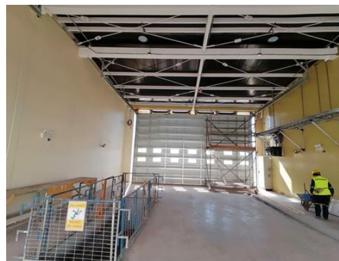
Taller Edificio Logístico, Edificios DGAC