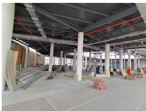
Instalación de ductos de clima, 2° Nivel, Ala Norte Edificio Terminal de Pasajeros (Ampliación)