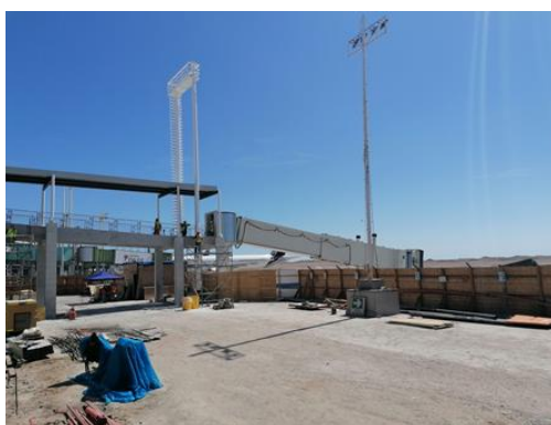
Montaje e Instalación de Mangas de Embarque N°5 y 6