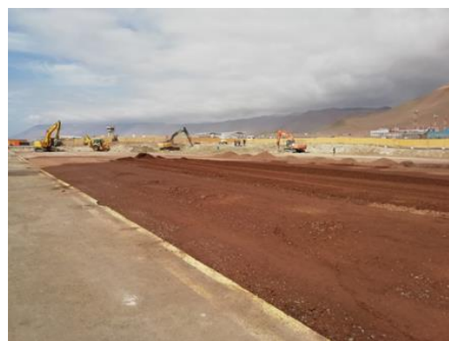
Colocación Sub-Base Plataforma Comercial