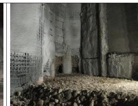
(26.02.20) obras Nudo Kennedy Excavación de estructura E-19. Se completa revestimiento de muros forro.