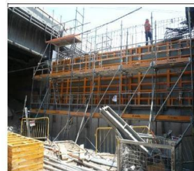
14.02.2020 Viaducto El Salto Estribo 1.- colocación de armadura y moldajes.