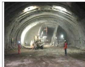
(12.02.20), Frente Sur Fase III. Vista general de la caverna. Se aprecian las tres fases de excavación parcial y los 2 hastiales temporales. Dm 2.621.