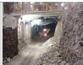
(26.02.20), Pique Losa 47 Nivel Intermedio - 1 (Dm 3.811,6): excavación bajo losa intermedia hacia nivel -2, a todo el ancho de la trinchera.