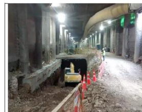
(14.02.20), Pique Losa 47 Nivel Intermedio - 1 (Dm 3.811,6): El 12.02.20, se inició excavación desde el nivel de losa intermedia hacia nivel -2.