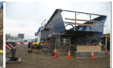
(22.06.2020), Viga 4: Bateas VP7 y VP8 alineadas y niveladas para soldadura de terminación en empalme en Unión Z.