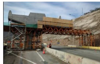
(30.06.2020) Cepa 15 Viaducto El Salto: Hormigonado el Dintel, se retira moldajes y estructura MK.