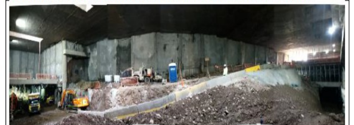
(08.07.20) Pozo 2 Dm 7.200 y Ramal 256: Izquierda excavación bajo losa superior v frente fase 1 túnel híbrido al sur. Derecha. preparación portal túnel minero al norte.