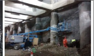
(10.06.2020), Losa 64.- Nivel -1. En ejecución Muros Forro costado izquierdo, del Dm 4.263 al Dm 4.284,4 sector 2.