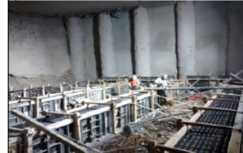
(04.06.2020) Trinchera 6.1. (Dm 5.039) Preparada para hormigonar primer nivel de vigas (estampidores) transversales.