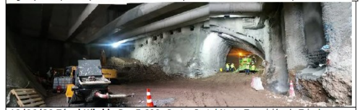
18/06/20 Túnel Híbrido Dm 5.600: Sector Portal Norte Transición de Trinchera Cubierta Doble a Túnel Híbrido. Excavación Fase 1 sentido al sur lado derecho.