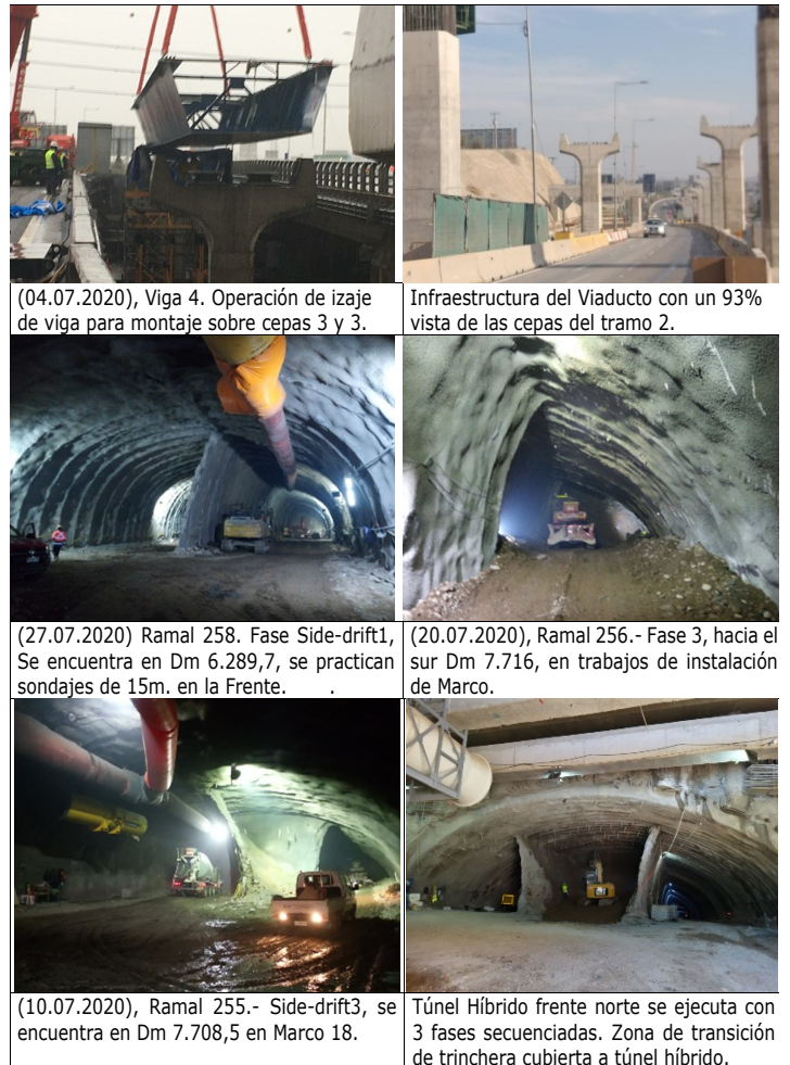
(04.07.2020), Viga 4. Operación de izaje de viga para montaje sobre cepas 3 y 3.