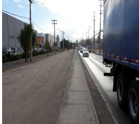
Limpeza y retiro de Basuras de la Faja

El proyecto no presenta avance físico en la actualidad