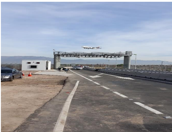
Pórtico sector Portón 12, lado norte