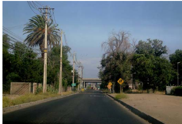
Llegada Lo Boza a Américo Vespucio Norte.