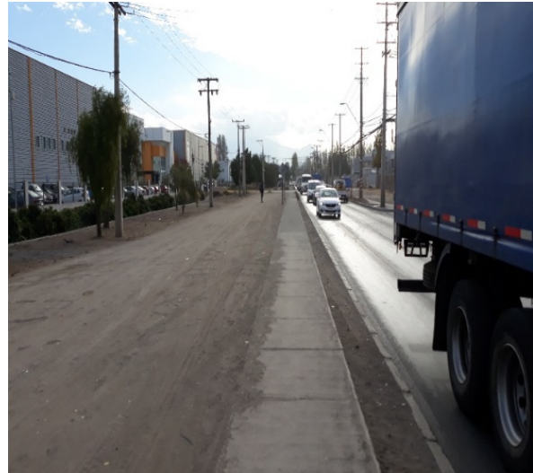
Limpieza y retiro de Basuras de la Faja