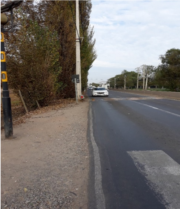
Limpieza y retiro de Basuras de la Faja.

Pasarelas Cordillera y Volcán Láscar del Tramo B1, que se encuentran en revisión para su aprobación. El proyecto no presenta avance físico en la actualidad