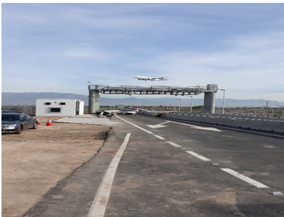
Pórtico sector Portón 12, lado norte.