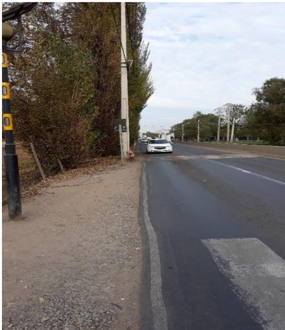
Limpieza y retiro de Basuras de la Faja