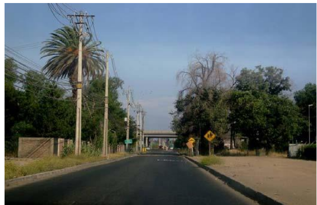
Llegada Lo Boza a Américo Vespucio Norte