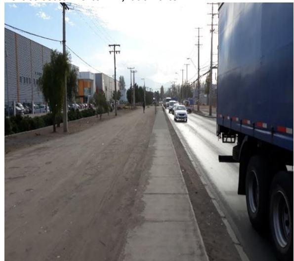
Limpieza y retiro de Basuras de la Faja