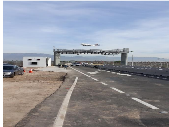
Pórtico sector Portón 12, lado norte

El proyecto no presenta avance físico en la actualidad