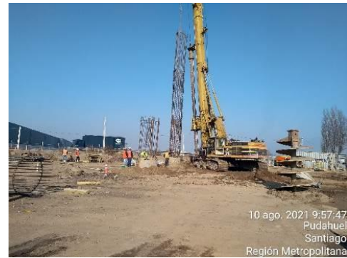
Colocación de enfierradura en excavación pilotes, para ser hormigonados en estribo de salida puente Paso Superior Pudahuel Oriente