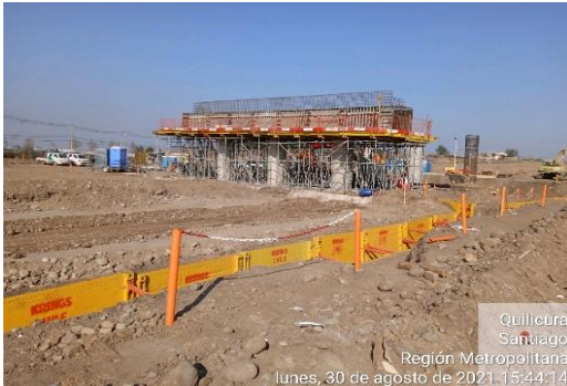
Colocación moldaje estribo salida PS Lo Marcoleta