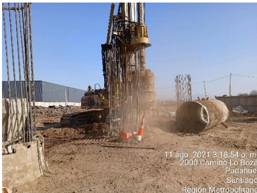
Excavación de pilotes en PS Pudahuel Oriente