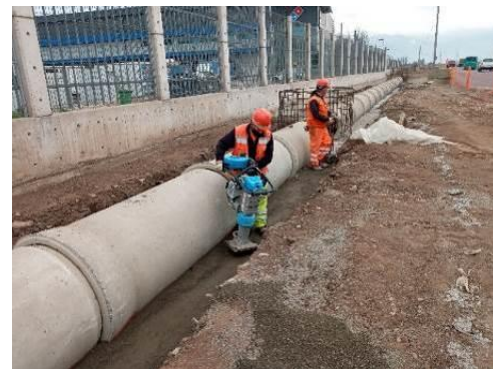
Compactación de relleno alrededor de tubo de cemento en colector sector Lo Marcoleta