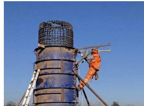
Columnas para recibir mesa de apoyo de estribo de entrada en puente Paso Superior Lo Marcoleta