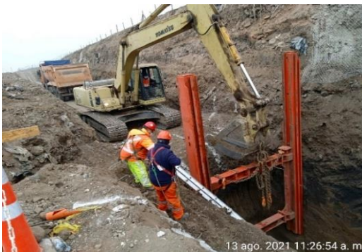
Excavación colector aguas lluvia y entibación