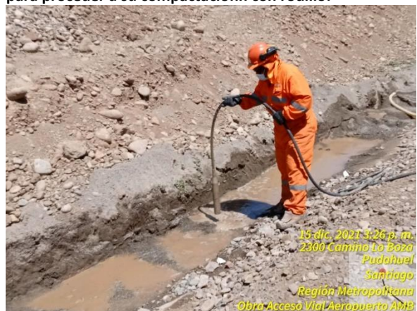
Compactación hidráulica con vibrador interno en relleno de excavación de colector.