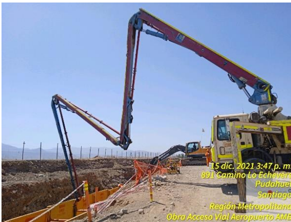
Hormigonado de cámara en colector pluvial de 1.450mm de ancho.