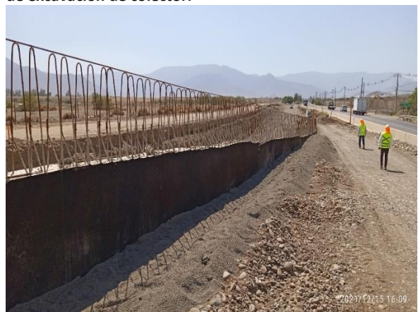
Muro de hormigón convencional en sector norte de Paso Superior Lo Marcoleta.