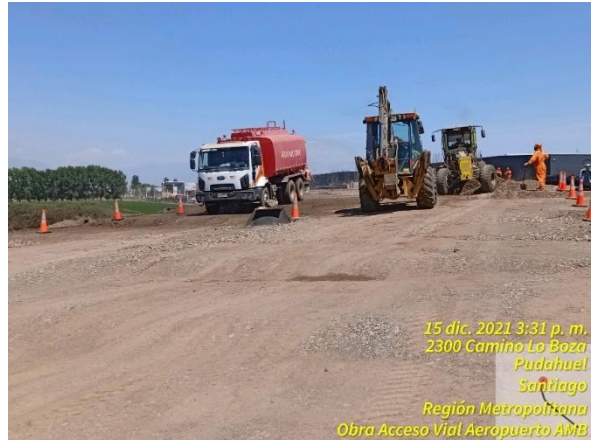
Humectado de relleno muro TEM con camión cisterna para proceder a su compactación con rodillo.