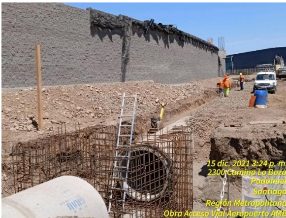
Armadura cámara en sector muro TEM en Paso Superior Pudahuel Oriente.