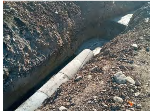
Instalación de colector de sumidero transversal en salida norte de P.S. Pudahuel Oriente