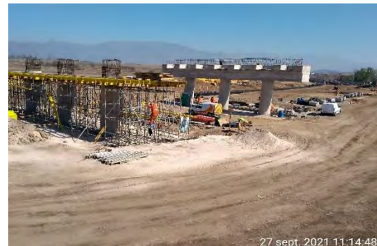
Estribo de salida de P.S. Lo Marcoleta ya desmoldado y colocación de moldajes para mesa de apoyo en estribo de entrada