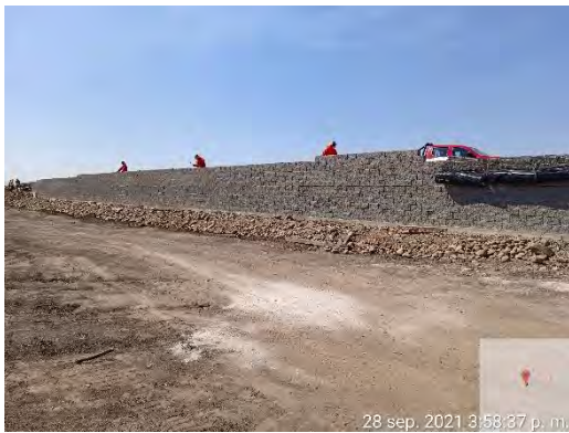
Instalación de bloques de hormigón, componentes del muro TEM, en salida norte de P.S. Lo Marcoleta