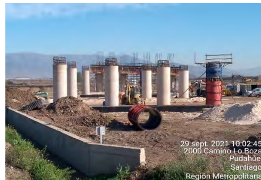
P.S. Pudahuel, estribo de entrada: colocación de material de pomacita en viga de amarre