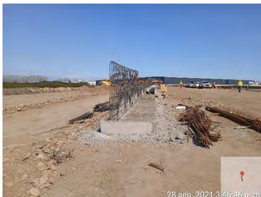
Preparación de enfierradura en muro de contención en hormigón convencional, en salida norte de P.S. Lo Marcoleta