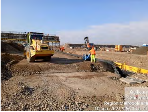
Distribución de relleno estructural en muro TEM, salida norte de P.S. Pudahuel Oriente