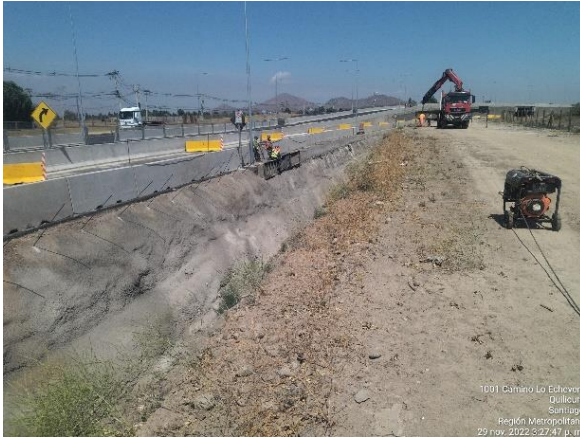
RETIRO DE MOLDAJES REFUERZO SUPERIOR DE HORMIGÓN FOSO REVESTIDO CALLE LOCAL SUR