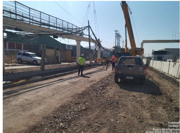
MONTAJE VIGA PASARELA VOLCÁN LASCAR