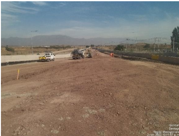
PREPARACIÓN DE SUBRASANTE VÍAS EXPRESAS KM 6.650 SALIDA LO MARCOLETA