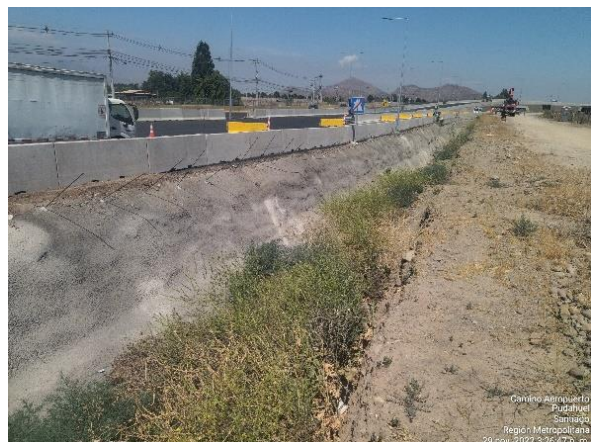
RETIRO DE MOLDAJES REFUERZO SUPERIOR DE HORMIGÓN FOSO REVESTIDO CALLE LOCAL SUR