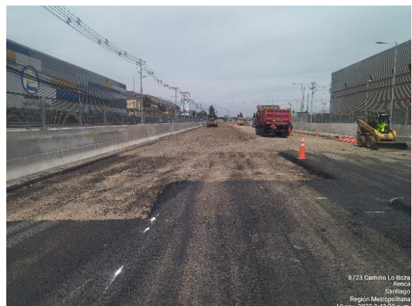
PREPARACIÓN BASE GRANULAR SECTOR KM 4.000