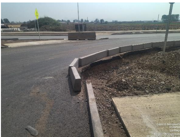
INSTALACIÓN SOLERAS TIPO A SECTOR NORTE PS PUDAHUEL