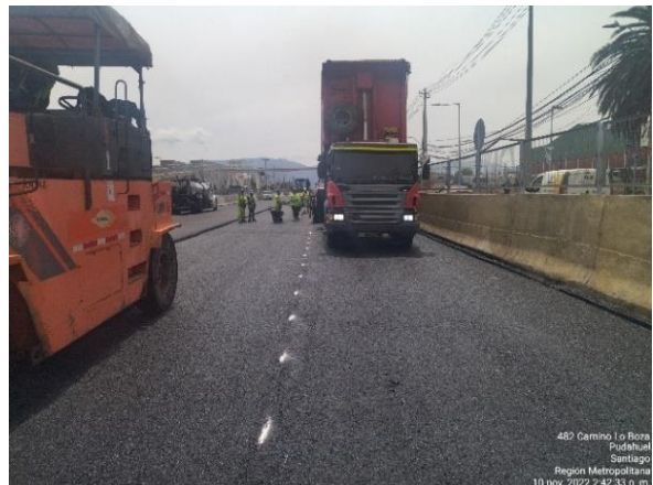
PAVIMENTACIÓN VÍAS EXPRESAS KM 4.300