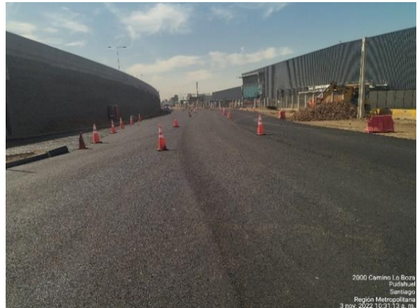
PAVIMENTACIÓN LO BOZA SECTOR KM 1700 A 1850