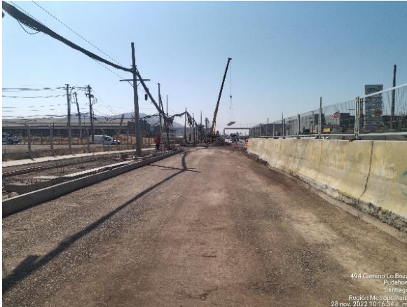
MONTAJE VIGA PASARELA CORDILLERA