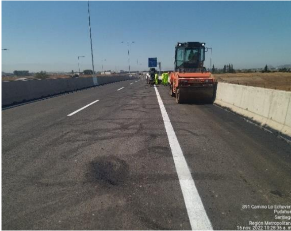
LIMPIEZA VÍA EXPRESA KM 70, CALLE LOCAL SUR