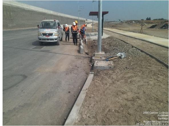
INSTALACIÓN SOLERAS RAMAL NORTE PS PUDAHUEL