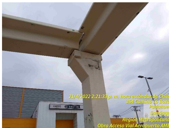
Encuentro de esquina en PP Cordillera