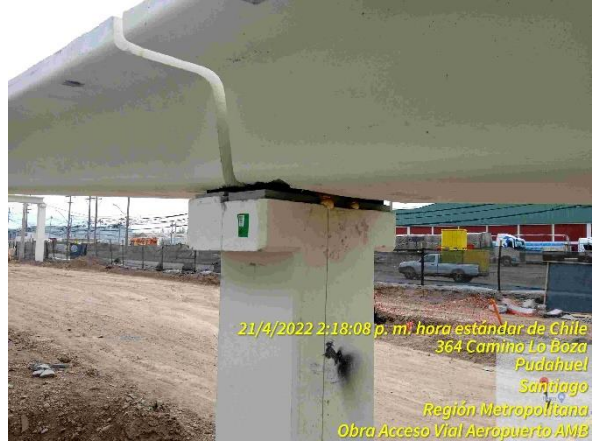
Apoyo de viga en PP Cordillera.