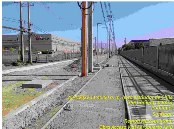
Preparación de bases para ciclovía y acera.