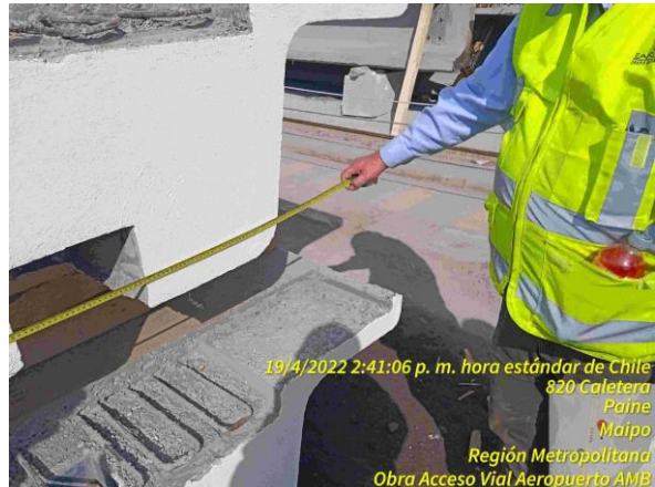
Revisión de medidas de viga para PP Cordillera en Planta Tensacón.