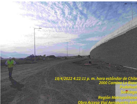
Muro TEM terminado PS Pudahuel salida norte.