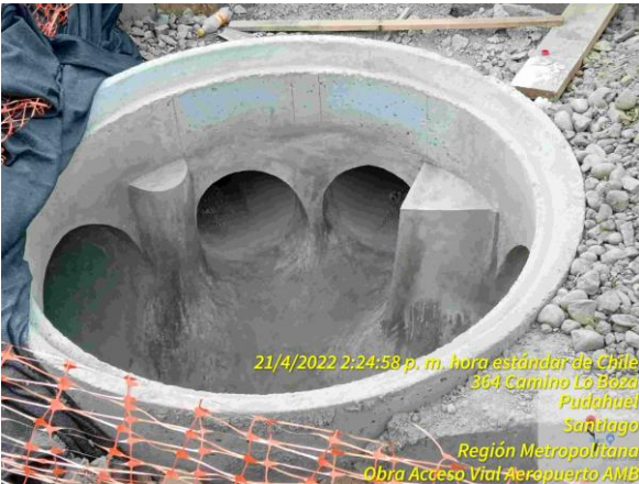
Cámara de entrada múltiple en sector Lo Boza Dm 4.300 aprox.