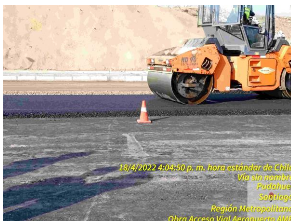
Colocación de binder de pavimento asfáltico