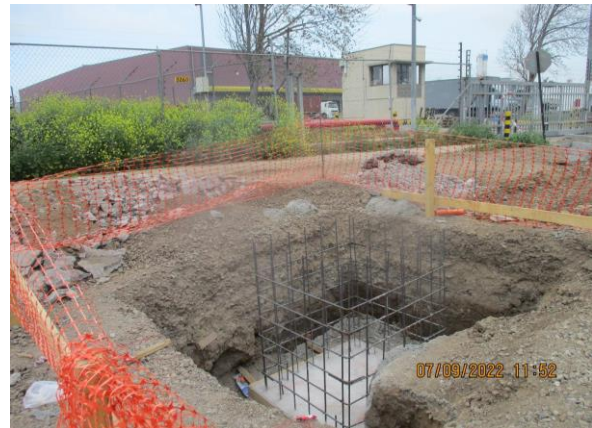
ENFIERRADURA SUMIDERO N°1A AV. CONDELL KM 3.260