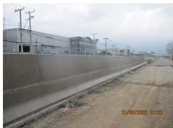
BARRERA DE HORMIGON IN SITU KM 4.800 A KM 5.000 EJE B