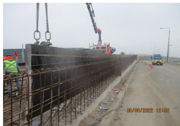
MOLDAJE BARRERA SOBRE CONVENCIONAL LADO NORTE PUDAHUEL ORIENTE