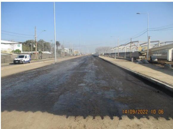
IMPRIMACION EJE B CALZADA NORTE KM 4.800 A KM 5.000