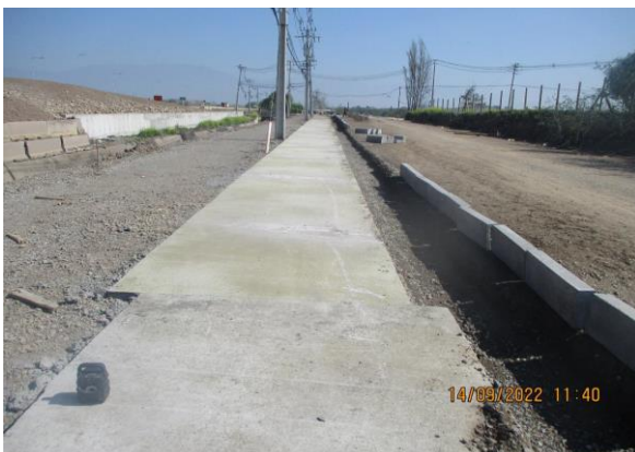
ACERAS CALLE DE SERVICIO NORTE 2 KM 100 A KM 150