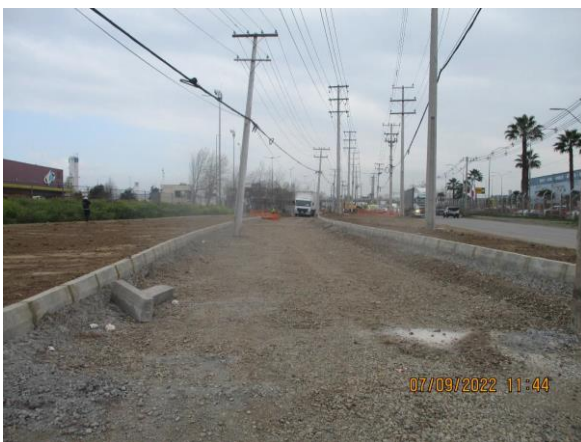
SOLERAS TIPO "A" AV. CONDELL KM 3.200 A KM 3.280