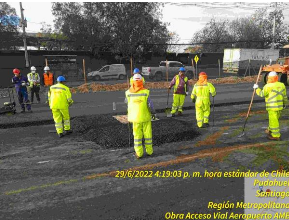
Terminación con asfalto alrededor de cámara de inspección en sector Lo Boza Dm 3.800 aprox