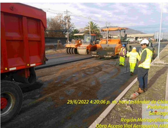
Colocación de Bínder en sector Lo Boza en Dm 3.750 aprox.