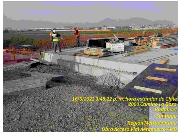
Preparación de armadura para barrera de protección en puente de PS Pudahuel Oriente