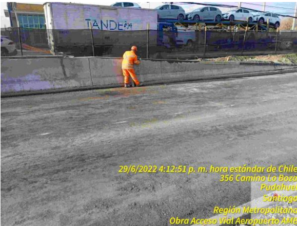
Mejorando terminación de barrera in situ en sector Lo Boza Dm 3.900 aprox.