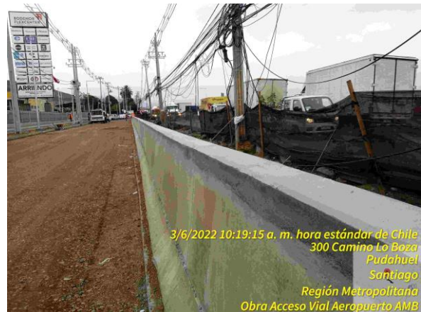
Vista lateral de barrera in situ