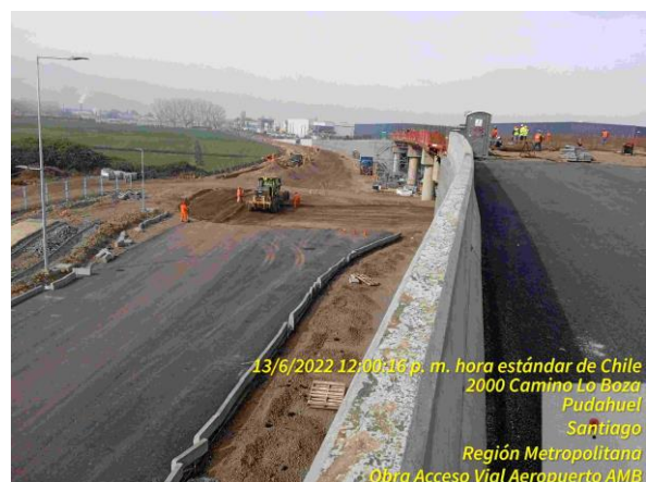
Preparación de base para pavimento de cruce bajo el PS Pudahuel Oriente