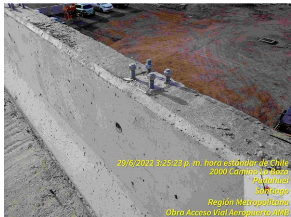
Pernos insertos para colocación de baranda en puente de PS Pudahuel Oriente