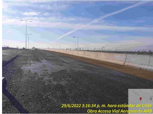
Aplicación de imprimante sector PS Lo Marcoleta