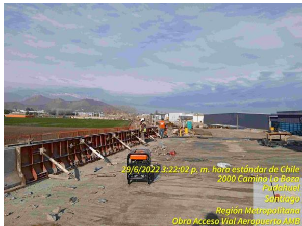
Preparación de moldaje para hormigonar barrera sobre losa de puente PS Pudahuel Oriente