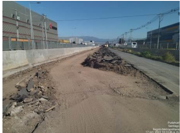
DEMOLICIÓN PAVIMENTO EXISTENTE KM 3.800 VÍA EXPRESA