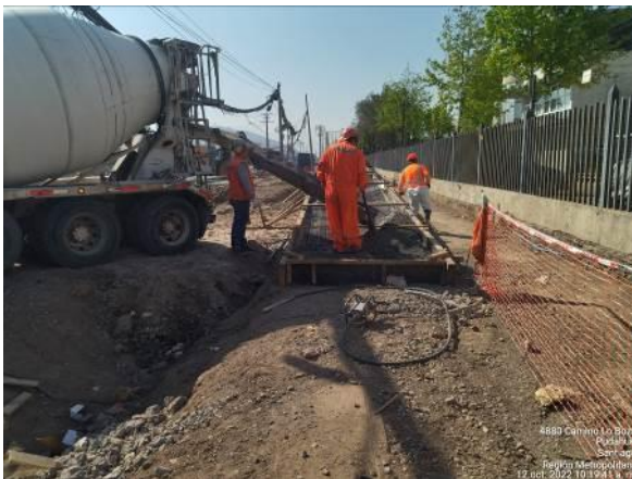
HORMIGONADO RAMPA ACCESO PASARELA LASCAR LADO NORTE