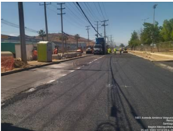
PAVIMENTACIÓN CALLE CONDELL KM 3.335