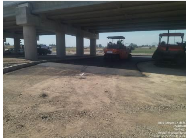
ASFALTO PASO SUPERIOR PUDAHUEL ORIENTE CON CAMINO LO BOZA