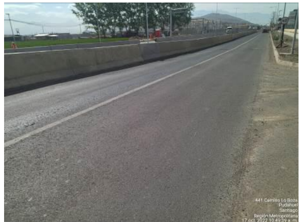
PAVIMENTO CALLE LOCAL NORTE LO BOZA KM 5.400