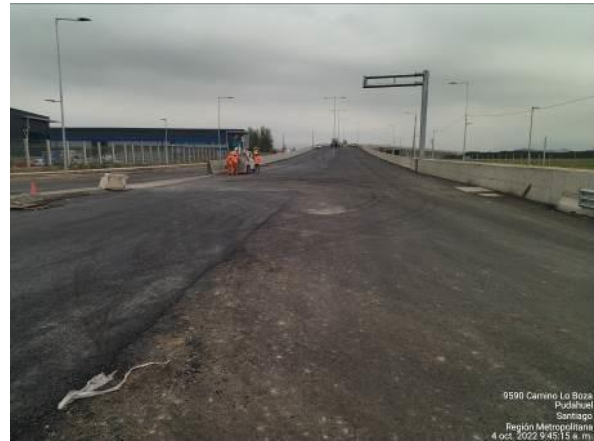
PASO SUPERIOR PUDAHUEL ORIENTE