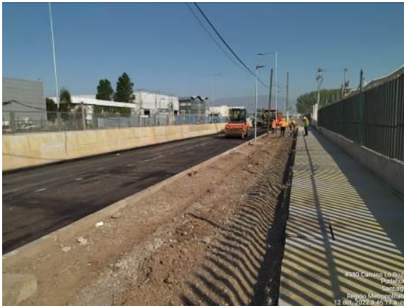
CARPETA ASFÁLTICA CALLE LATERAL SUR KM 5.100