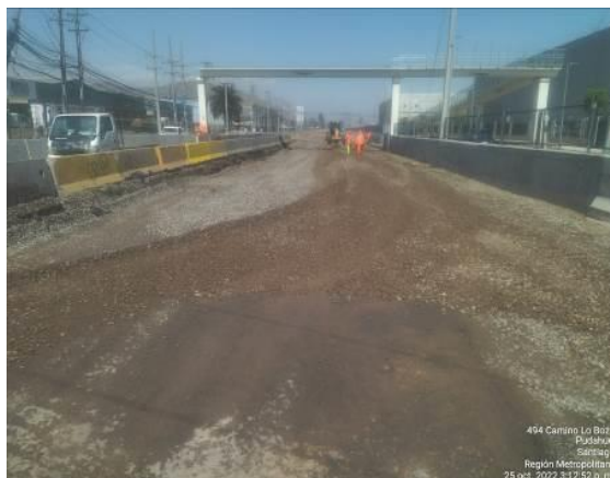
COLOCACIÓN DE BASE ESTABILIZADA LO BOZA KM 4.800