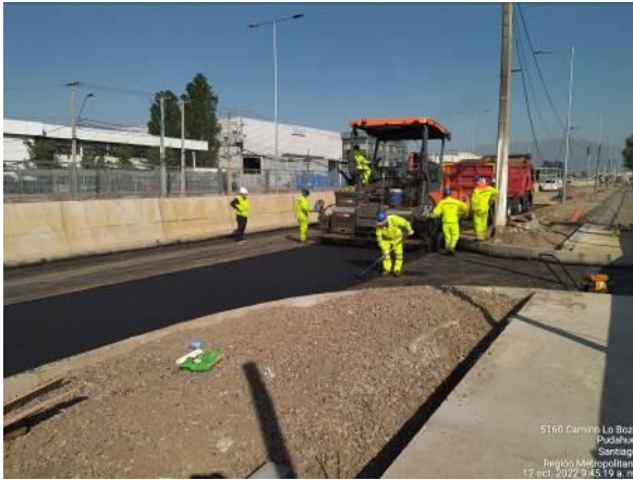
PAVIMENTACIÓN CALLE LOCAL SUR LO BOZA KM 4.850