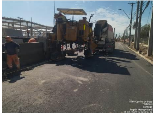
PAVIMENTACIÓN BARRERAS DE HORMIGÓN KM 5.100