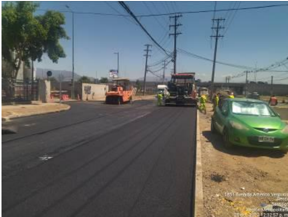
PAVIMENTACIÓN CALLE CONDELL KM 3.240