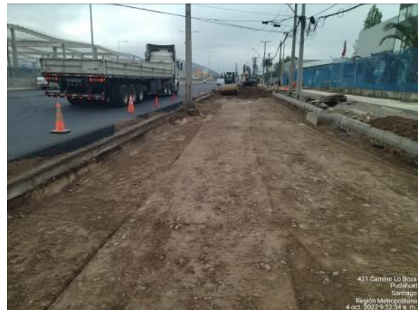
EXCAVACIÓN CALLE LOCAL NORTE KM 4.90