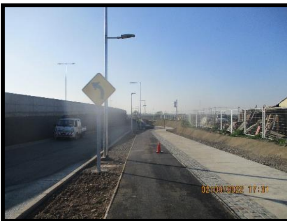
Ramal A Km 100 a Km 250