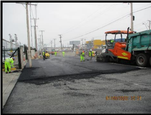
Concreto asfáltico de rodadura CLS km 4.600 a km 4.700