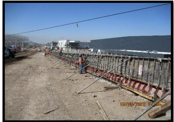
Moldajes barrera lateral sobre convencional Pudahuel Oriente