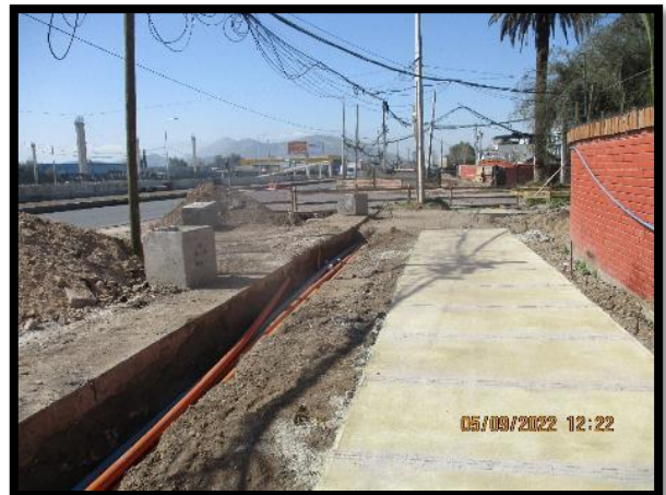
Canalización eléctrica y riego calle local sur km 5.000 a km 5.100