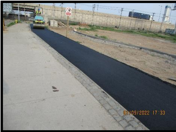
Tratamiento superficial simple ciclo vía km 3.600 a km 3.900