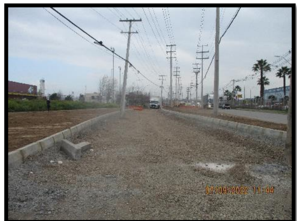
Av. Condell Km 3.200 a Km 3.300