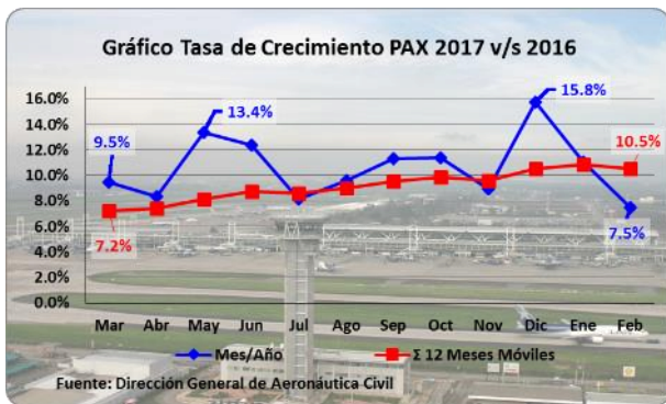
Gráfico 1: Tasa de Crecimiento 2017 v/s 2016

NOTA: La variación del año 2017 c/r al año anterior se realiza con los datos consolidados hasta febrero en ambos años.