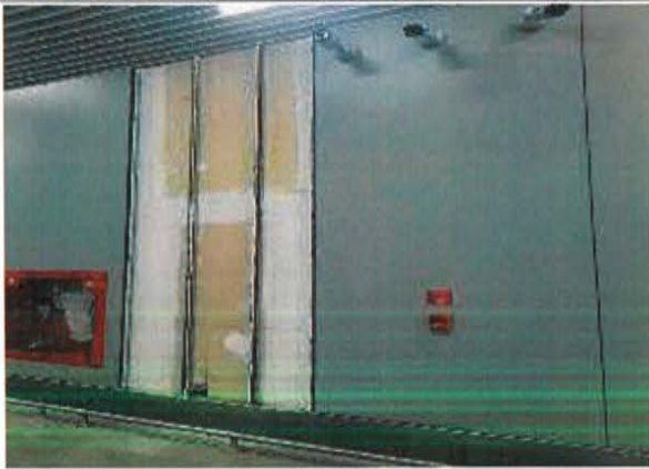
Espigón D: Se instala Tag al Pulsador Manual de Incendio.