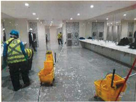
T2M: Baños generales de primer nivel.