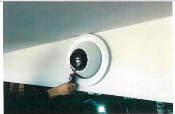
Espigón F: Medición de caudal de difusor