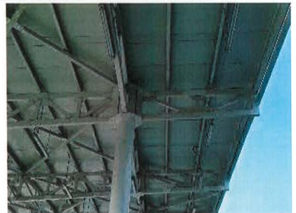
SEC-O: Touch up general a estructura de cubierta y pilares