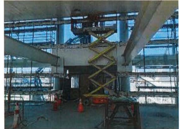
T1A: Vista acceso pre-puentes.