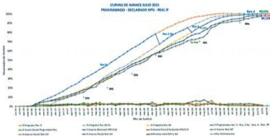
Curva S (Avance Físico de la Obra)