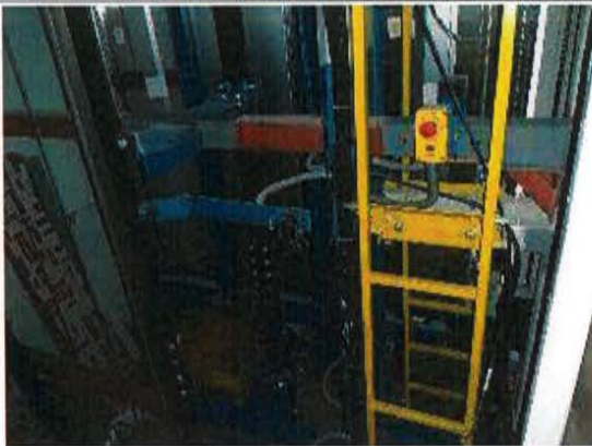
ESO: levantamiento de observaciones realizadas en pruebas SAT de Ascensores