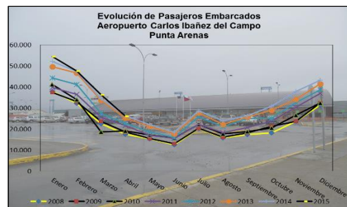
Gráfico 2: Pasajeros Embarcados de 2008 a 2015