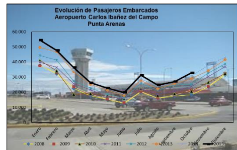
Gráfico 2: Pasajeros Embarcados de 2008 a 2015