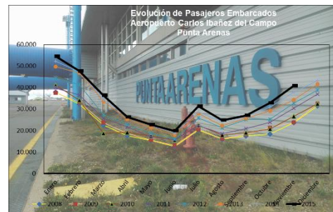
Gráfico 2: Pasajeros Embarcados de 2008 a 2015