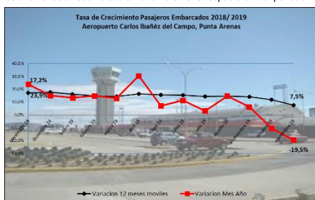
Gráfico 1: Tasa de Crecimiento Pasajeros Embarcados últimos 12 meses

(*) Corresponde a la variación acumulada a noviembre 2019 respecto similar periodo 2018.