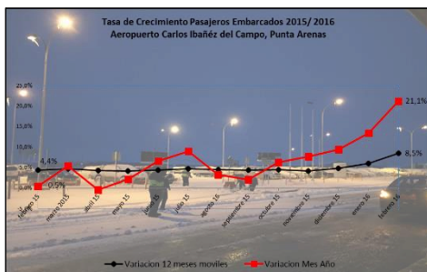
Gráfico 1: Tasa de Crecimiento últimos 12 meses

* Corresponde a la variación acumulada a febrero 2016 respecto similar período 2015.