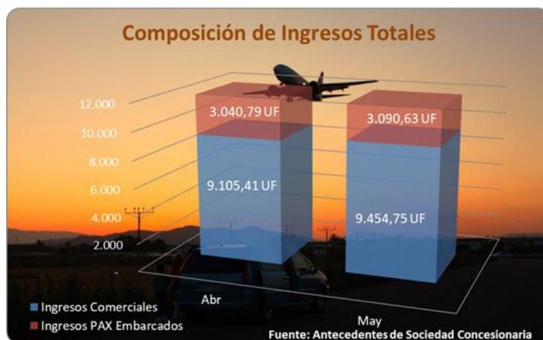
Gráfico 3: participación de los ingresos por pasajero embarcado en el total de ingresos de la Sociedad Concesionaria.

El mayor porcentaje de ingresos de la SC es por concepto de ingresos comerciales. Al comparar ambos meses, los ingresos totales disminuyeron un 6,1%, a efecto de los menores ingresos comerciales en un 7,8% y a una leve baja los ingresos por PAX en un 1,1%.