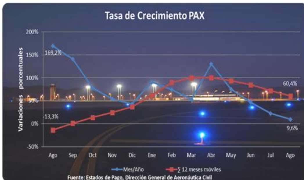
Gráfico 2: Comparativa de las curvas de pasajero embarcado mismo mes, respecto del año anterior y la curva de pasajero embarcado acumulado a 12 meses.

La variación de los 12 últimos meses, para el mes en análisis (08/2022). Los datos acumulados en los últimos 12 meses móviles representan una caída en cuando al ritmo de crecimiento, lo cual es totalmente esperable en tanto la base de comparación es relativa a un año más "normalizado" como lo fue el año 2021. Para este análisis ya desaparece en un 50% el efecto crecimiento que significo comparar las cifras con la base del año 2020.