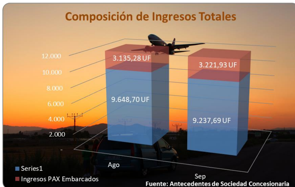
Gráfico 3: participación de los ingresos por pasajero embarcado en el total de ingresos de la Sociedad Concesionaria.

Estos mayores ingresos quedan de manifiesto en los estados financieros del primer trimestre con un mayor margen de explotación a pesar del incremento de los costos operacionales.