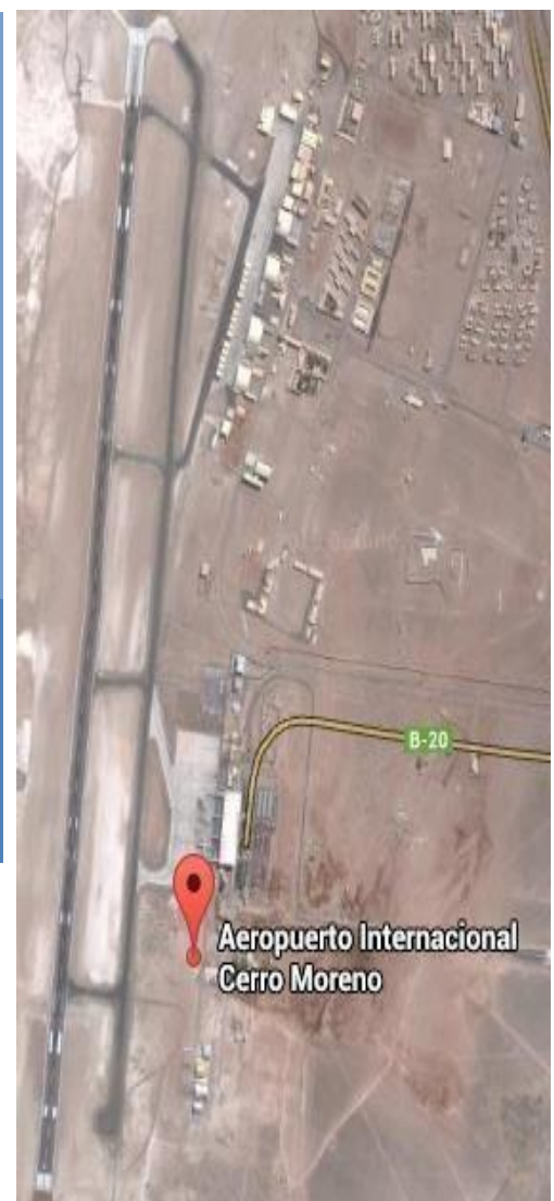
Figura 2: Vista satelital del emplazamiento de la pista y edificio terminal Aeropuerto Cerro Moreno.