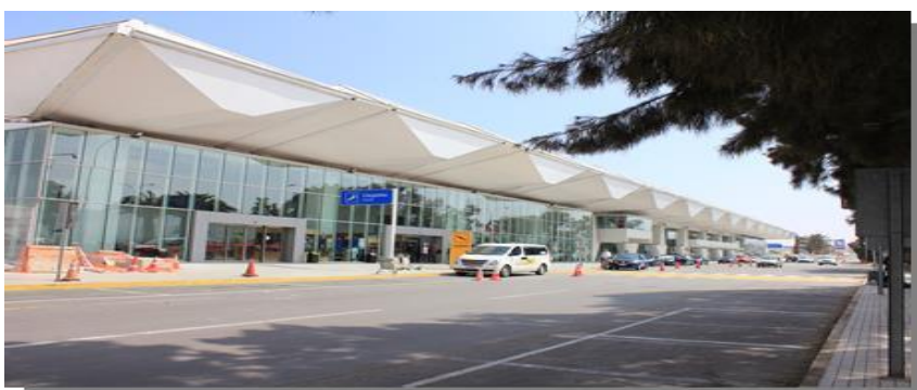
Figura 1: Frontis Edificio Terminal Aeropuerto Cerro Moreno.