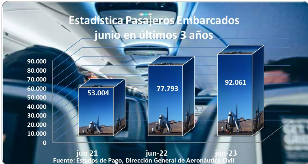
Gráfico 2: Estadística pasajeros embarcados en abril, últimos tres años

En la Gráfica siguiente, se presenta el registro de pasajeros embarcados durante el mes de mayo, en último trienio. En él se aprecia que los efectos de las restricciones sanitarias afectaron sobre el 50% del flujo de pasajeros de un año considerado como normal.