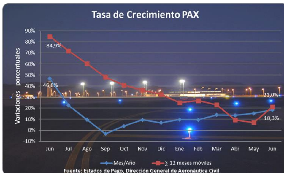
Gráfico 3: evolución variación porcentual año móvil versus variación porcentual mes a mes.

La variación de los 12 últimos meses, para el mes en análisis (05/2023). Se aprecia la convergencia de ambas curvas, al desaparecer el efecto pandemia, el cual se marcó con mayor notoriedad durante el año 2020.