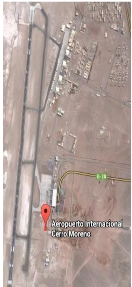
Figura 2: Vista satelital del emplazamiento de la pista y edificio terminal Aeropuerto Cerro Moreno.