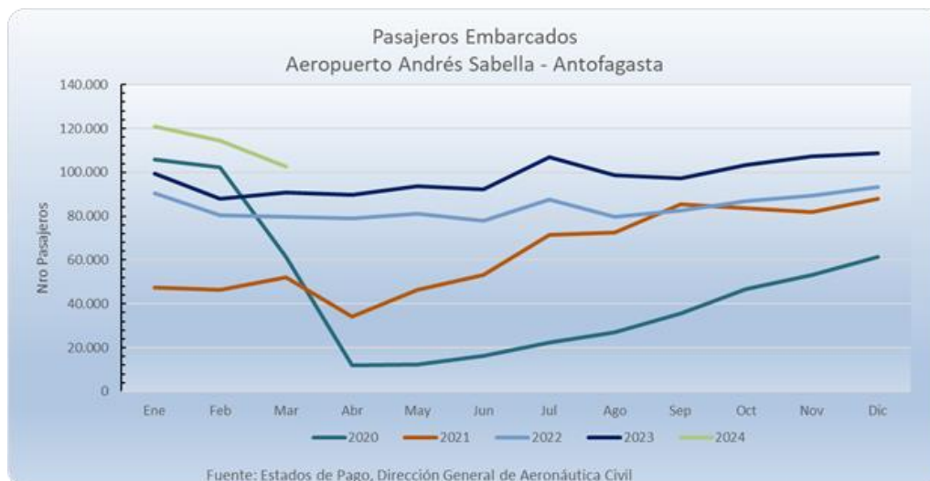
Gráfico 1: Evolución anual de pasajeros embarcados.

La tabla muestra lo evidenciado anteriormente en el gráfico N°1, en el sentido de que, si bien el número de pasajeros embarcados presenta similar tendencia a lo largo del Contrato de Concesión, en el año 2024 el porcentaje acumulado a 12 meses es de un 22%, reflejando de este modo el incremento en el flujo de pasajeros arribados como embarcados en el Edificio Terminal.