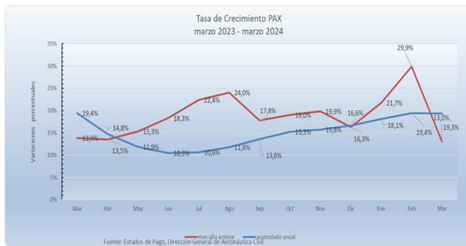
Gráfico 3: evolución variación porcentual año móvil versus variación porcentual mes a mes.

Ya superados los efectos de las restricciones de movilidad, se aprecia cómo el incremento de pasajeros respecto al año anterior, contribuye al acumulado a 12 meses. Una evidencia que se aprecia desde el mes de agosto de 2023.