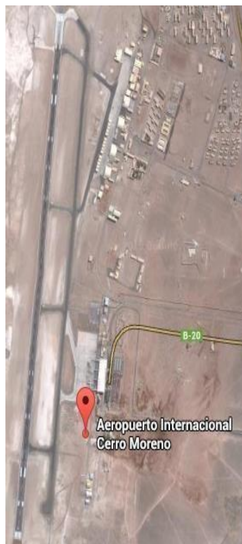
Figura 2: Vista satelital del emplazamiento de la pista y edificio terminal Aeropuerto Cerro Moreno.