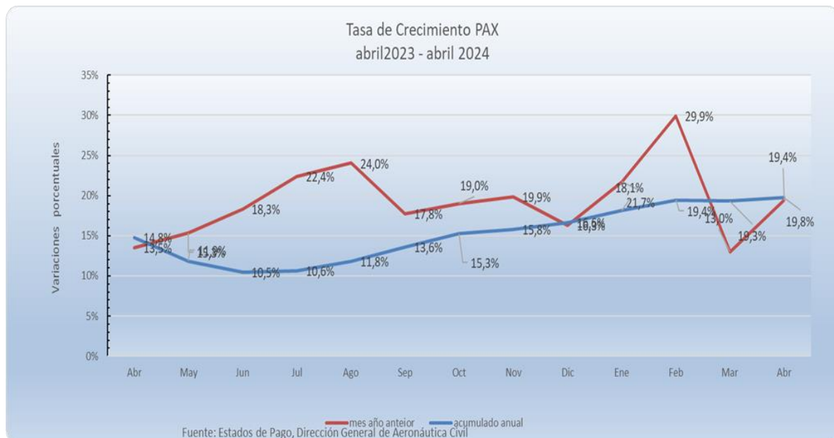
Gráfico 3: evolución variación porcentual año móvil versus variación porcentual mismo mes, año anterior.

Ya superados los efectos de las restricciones de movilidad, se aprecia una tendencia consistente al alza en términos acumulados, a partir del mes de agosto de 2023.