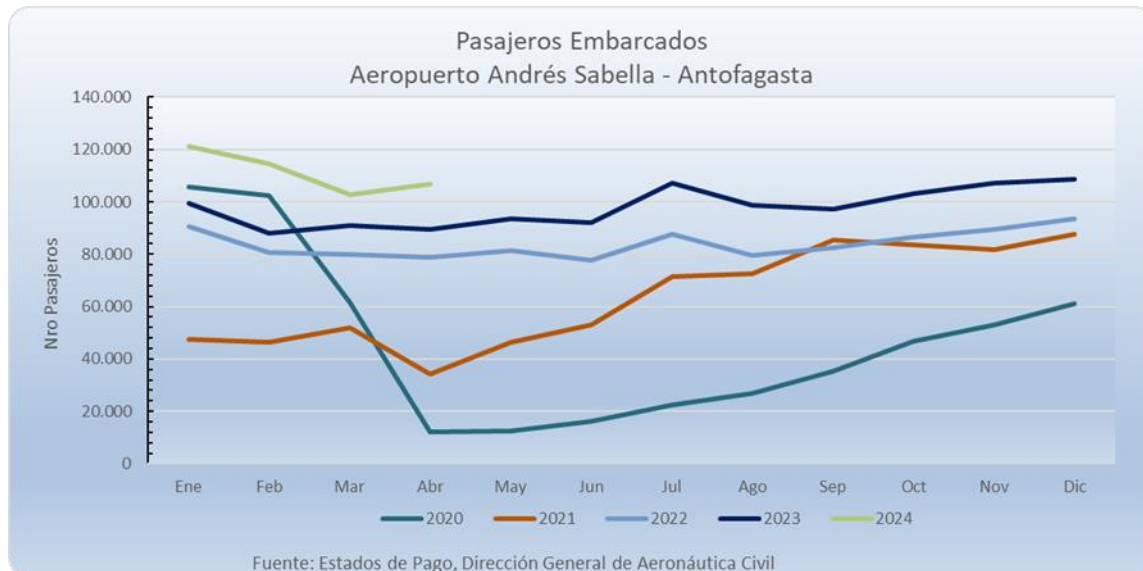
Gráfico 1: Evolución mensual de pasajeros embarcados. Últimos 5 años

En la tabla se presenta la estadística de pasajeros embarcados de manera mensual, de los últimos 3 años. Se aprecia que respecto al año anterior, el incremento es de un 19,4%. En tanto, en términos acumulado a 12 meses, el incremento es de un 19,8%.