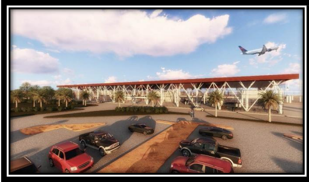
Vista general del Edificio Terminal del Aeropuerto