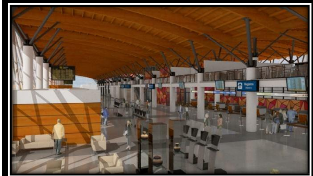
Vista interior 1er piso del Edificio Terminal del Aeropuerto