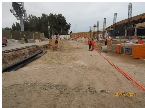
Construcción Vialidad frente Terminal de Pasajeros.