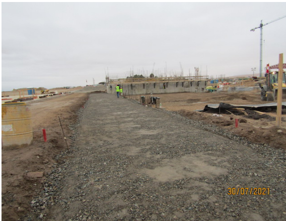
Construcción Nuevo Edificio SSEI – DGAC.