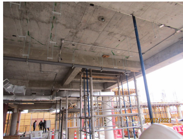
Ampliación Terminal de Pasajeros.