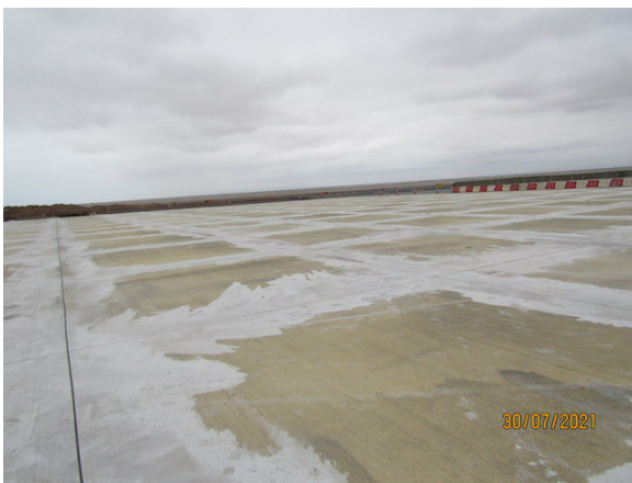
Ampliación Plataforma Comercial – DGAC.