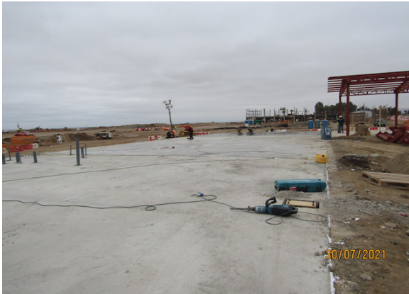
Construcción Nuevo Edificio Logístico – DGAC.