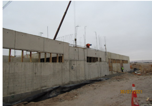
Construcción Nueva Subestación Eléctrica – DGAC.