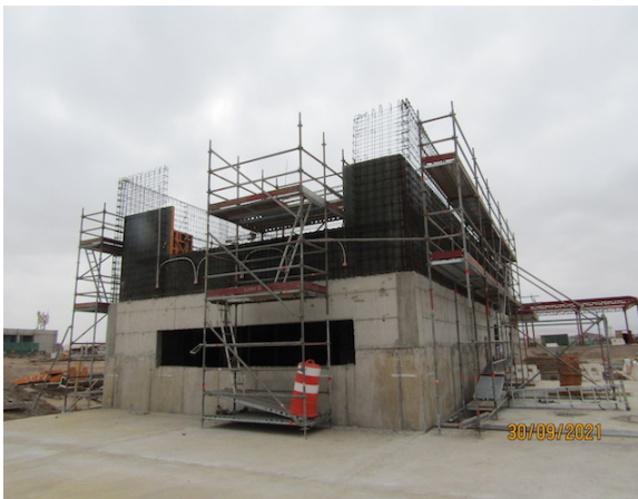
Construcción Nuevo Edificio SSEI – DGAC.