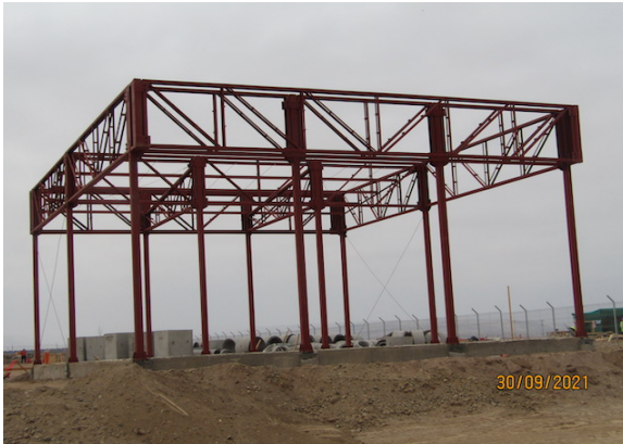
Construcción Nuevo Edificio Logístico – DGAC.