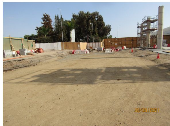
Construcción Vialidad frente Terminal de Pasajeros.