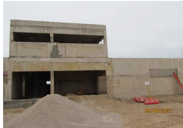
Construcción Nueva Subestación Eléctrica – DGAC.