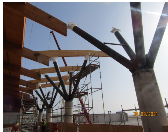
Ampliación Terminal de Pasajeros.