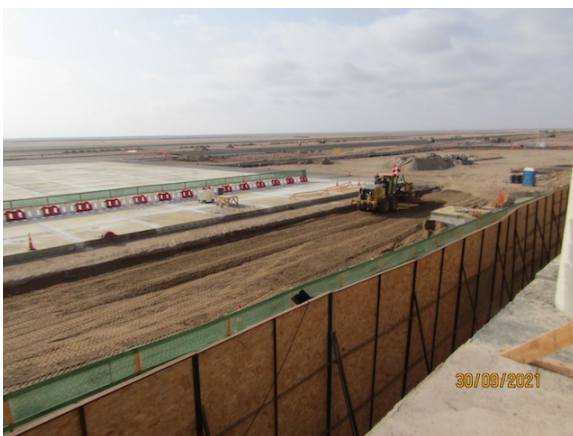
Ampliación Plataforma Comercial – DGAC.