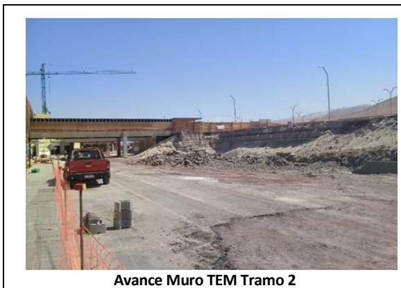
Avance Muro TEM Tramo 2