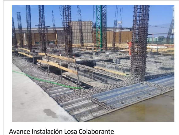
Avance Instalación Losa Colaborante