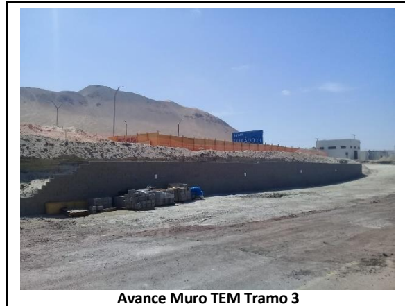
Avance Muro TEM Tramo 3