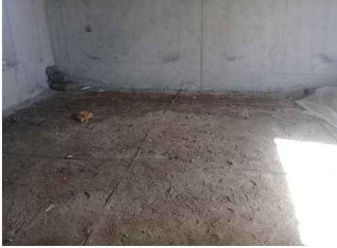
Malla a tierra compactación instalación sanitaria y radier SED