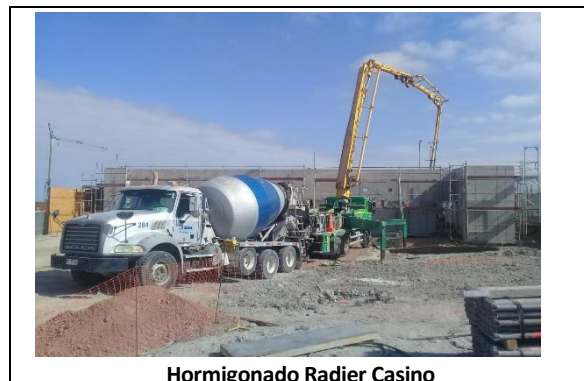
Hormigonado Radier Casino