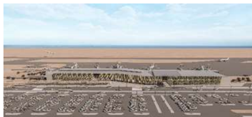
Vista proyectada sector ampliación Terminal de Pasajeros