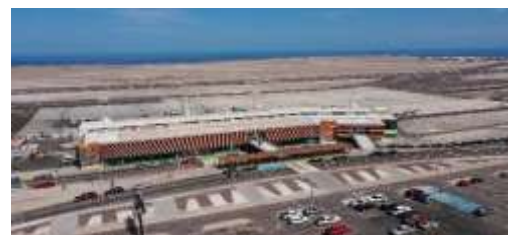
Vista actual Aeropuerto Diego Aracena de Iquique

No se cuenta con avances de obra a la fecha, debido a lo explicado en el punto anterior. Se adjuntan imágenes de maqueta virtual