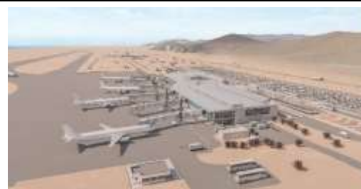
Vista proyectada sector airside, Plataforma estacionamiento de Aviones.