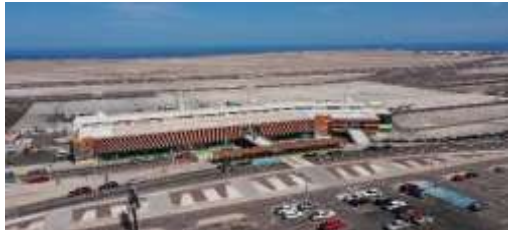
Vista actual Aeropuerto