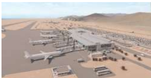
Vista proyectada sector airside, Plataforma Estacionamiento de Aviones.