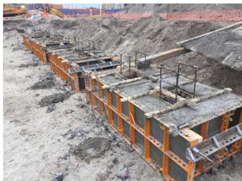
Enfierradura Fundaciones Edificios BLR-BSP-BAD