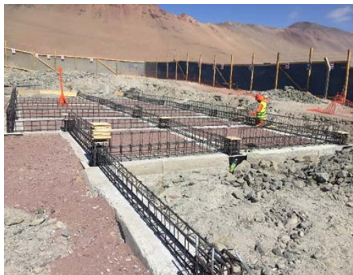
Enfierradura Vigas de Fundaciones Edificio SAR