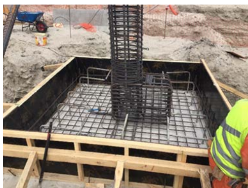
Enfierradura Fundación Edificio PAX, Zona 1.1. - Ampliación