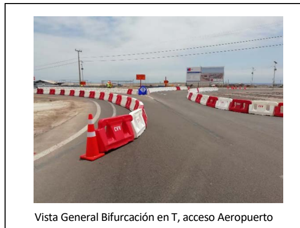
Vista General Bifurcación en T, acceso Aeropuerto

A la fecha, y en base a lo indicado en el punto anterior, la SC durante este periodo ha procedido con el avance de obras preliminares, las cuales se presentan en el siguiente registro fotográfico: