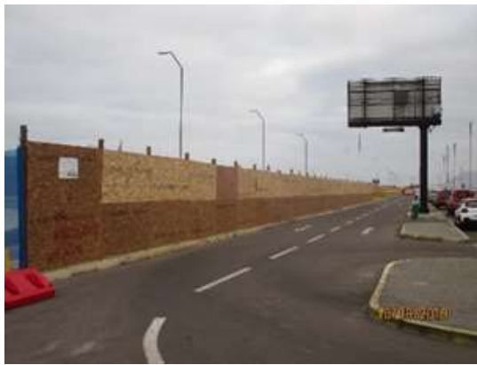
OBRAS PRELIMINARES: CIERRE PROVISORIO, SECTOR ESTACIONAMIENTO PUBLICO

A la fecha, y en base a lo indicado en el punto anterior, la Sociedad Concesionaria durante este periodo ha procedido con el avance de obras preliminares, las cuales se presentan en el siguiente registro fotográfico: