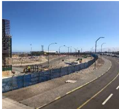
OBRAS PRELIMINARES: CIERROS PROVISORIOS SECTOR TERMINAL DE PASAJEROS