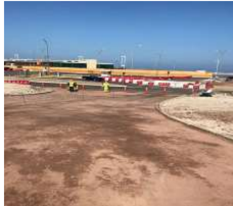
OBRAS PRELIMINARES: CIERROS PROVISORIOS SECTOR TERMINAL DE PASAJEROS