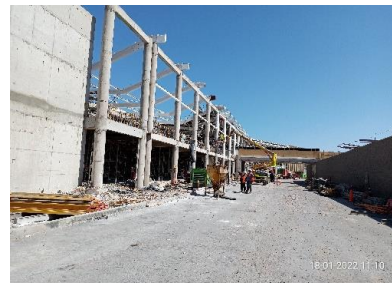
Vista Sector Ampliación Fachada Oriente Edificio Terminal, trabajos en instalación cubierta