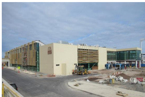
Edificio Terminal de Pasajeros, Instalación de Celosías

A la fecha, y en base a lo indicado en el punto anterior, la SC durante este periodo ha procedido con el avance de obras, las cuales se presentan en el siguiente registro fotográfico: