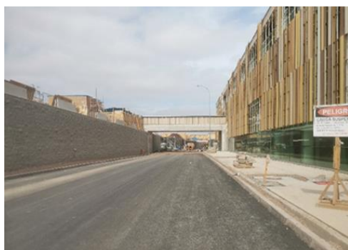
Asfalto Calle Piso 1 Dm. 120 al Dm.200