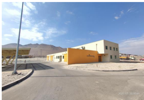
Subestación Eléctrica DGAC