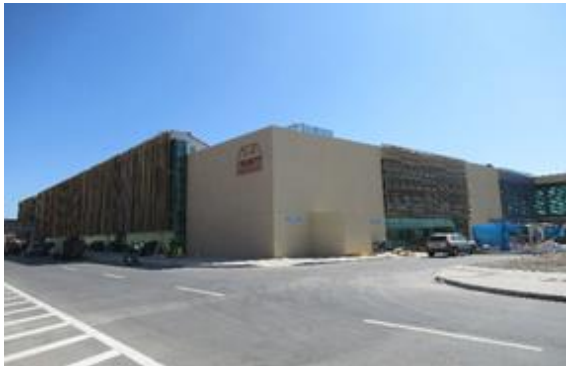
Vista Sector Ampliación Terminal de Pasajeros

A la fecha, y en base a lo indicado en el punto anterior, la SC durante este periodo ha procedido con el avance de obras, las cuales se presentan en el siguiente registro fotográfico: