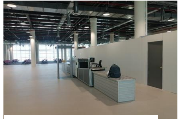
Sector AVSEC, Sector Ampliación Terminal de Pasajeros