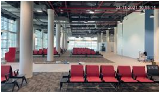
Sala embarque segundo nivel, Edificio Terminal Zona 1.1 (Ampliación)