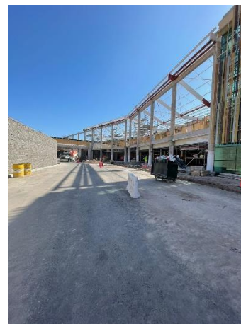
Montaje de estructuras metálicas para instalación de cubierta, ampliación fachada oriente