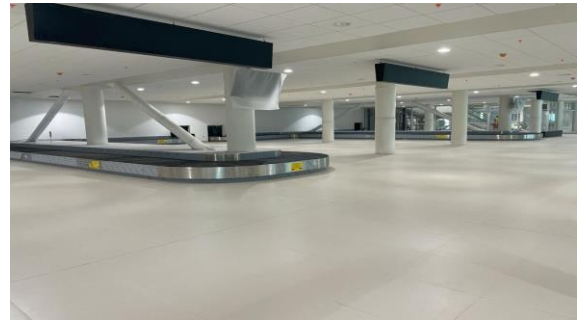
Sala retiro de equipaje, primer nivel, equipos de cintas de transporte