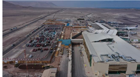
Vista aérea Sector Terminal de Pasajeros